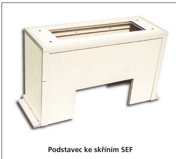
Podstavec ke skříním SEF