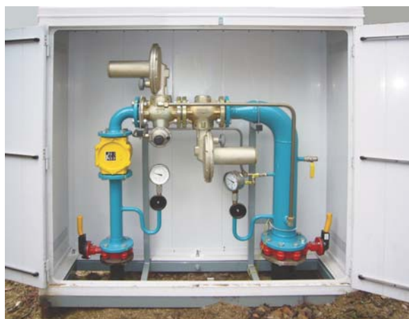
Jednořadá posilovací stanice STL NTL (sestava monitor – regulátor)