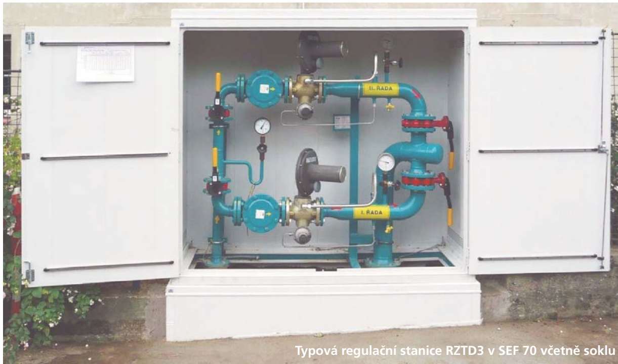
Typová regulační stanice RZTD3 v SEF 70 včetně soklu

Skříně SEF se používají jako opláštění regulačních zařízení nebo regulačních a měřicích stanic.