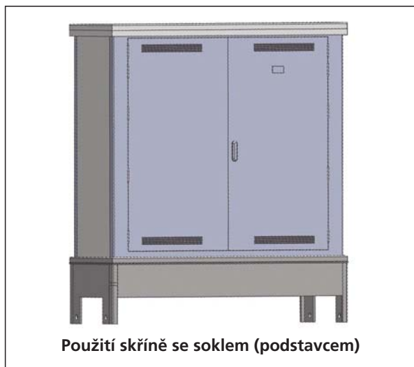
Použití skříně se soklem (podstavcem)